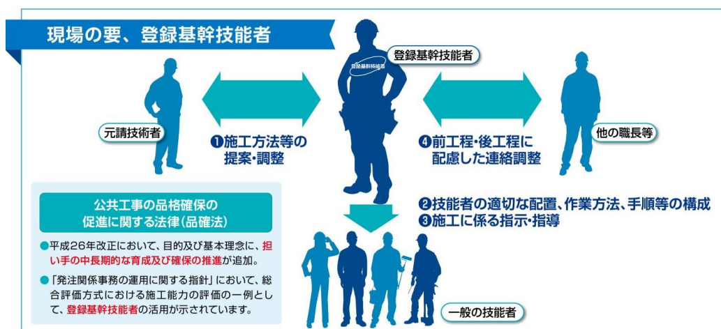
図-1 登録基幹技能者 1)

登録潜函基幹技能者は、潜函工事の施工および管理に関する業務に携わる技能者で、日本圧気技術協会の登録潜函基幹技能者講習を受講し、修了試験に合格し、資格認定を受けた者です。